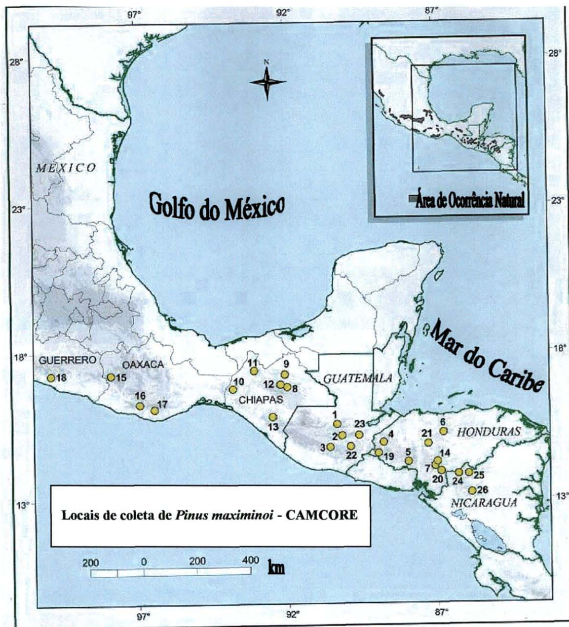
FIGURA 1 – LOCALIZAÇÃO GEOGRÁFICA DA ORIGEM DAS SEMENTES DE P. maximinoi COLETADAS PELA CAMCORE

Na região de ocorrência natural, a dispersão das sementes ocorre entre a segunda e a terceira semana de abril, no período anterior ao início da estação chuvosa. Em média, cada cone contém cerca de 145 sementes. Há entre 55.000 a 115.000 sementes por quilograma (média de 75.500), dependendo da longitude do local de coleta das sementes (DVORAK et al., 2000).