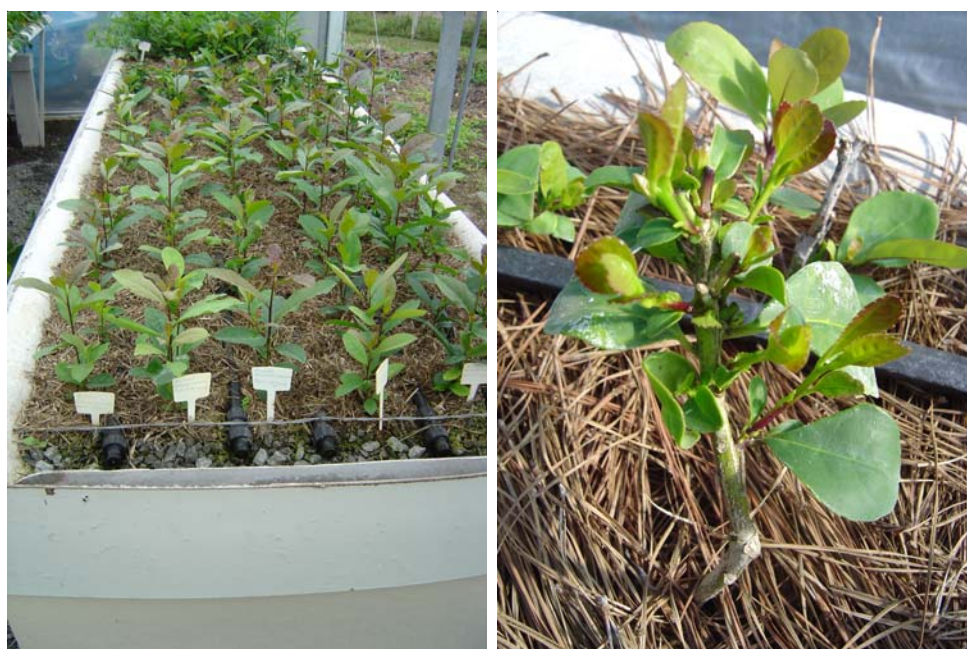
Fig. 1. Mudanças de erva-mate plantadas em sistema semi-hidropônico (canaletão) com areia, antes da primeira poda de seus ápices (à esquerda), e minicepa após cinco podas, para coleta de miniastacas (à direita).

A ministaquia é uma técnica que consiste em manter as plantas em recipientes, no viveiro (jardim miniclinal), onde, após a poda dos ápices, estes emitem brotações que serão coletadas em intervalos regulares e estaqueadas em casa-de-vegetação, originando as mudas para o plantio comercial. Em relação à técnica de estaquia convencional, a ministaquia apresenta várias vantagens como: dispensa do jardim clonal de campo; maior facilidade no controle de patógenos; maior produtividade; maior produção de propágulos (miniastacas) por unidade de área e em menor tempo; necessidade de menores concentrações de reguladores de crescimento vegetal e, em alguns casos, até a sua dispensa; melhor qualidade do sistema radicular e redução do tempo de formação da muda. As desvantagens da ministaquia em relação à estaquia convencional podem ser: maior sensibilidade das miniastacas às condições ambientais; maior rapidez requerida no processo desde a coleta dos propágulos no jardim até a sua estaquia; necessidade de melhor sincronização no cronograma de produção.