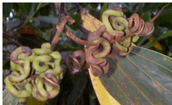
Fig. 2. Frutos de A. Mangium .

Malvaceae, Chenopodiaceae, Convolvulaceae, Liliaceae e Solanaceae. Sem tratamento pré-germinativo, a germinação é lenta e irregular (Lima e Garcia, 1996). É necessária a imersão das sementes em água fervente por 30 segundos, numa proporção de cinco partes de água para uma parte de volume de sementes. Deve-se colocá-las em seguida em água a temperatura ambiente por 24 horas. As sementes começam a germinar em dois a três dias após a sementeira e completam o processo em dez dias (Azevedo et al., 1998).