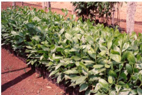
Fig. 4. Mudanças de A. mangium aos 3 meses de idade.

Para uniformizar o tamanho das plantas e estimular o crescimento no viveiro, recomenda-se a aplicação de 1 g por planta de NPK fórmula 10-30-10, quando as plantas estiverem com aproximadamente 10 semanas de idade.