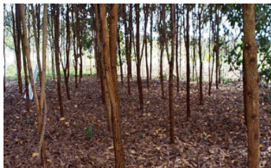
Fig. 5. Povoamento de A. Mangium .

Em geral, têm-se observado melhores resultados com a aplicação do fertilizante na cova. É recomendada a aplicação de 150 g de superfosfato simples na cova de plantio. Segundo Faria et al. (1996), a A. mangium responde positivamente à aplicação de superfosfato simples em solos de baixa fertilidade natural.