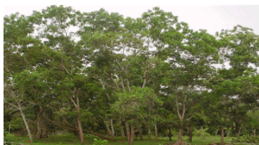
Fig. 6. Plantio de A. mangium aos 7

Em outro experimento da Embrapa Amazônia Ocidental, este conduzido em Manaus (AM), a A. mangium destacou-se dentre outras 25 espécies plantadas, tanto nativas quanto exóticas, obtendo os melhores valores de produção de madeira. Os resultados, aos 2 e 4 anos, estão contidos na Tabela 3.