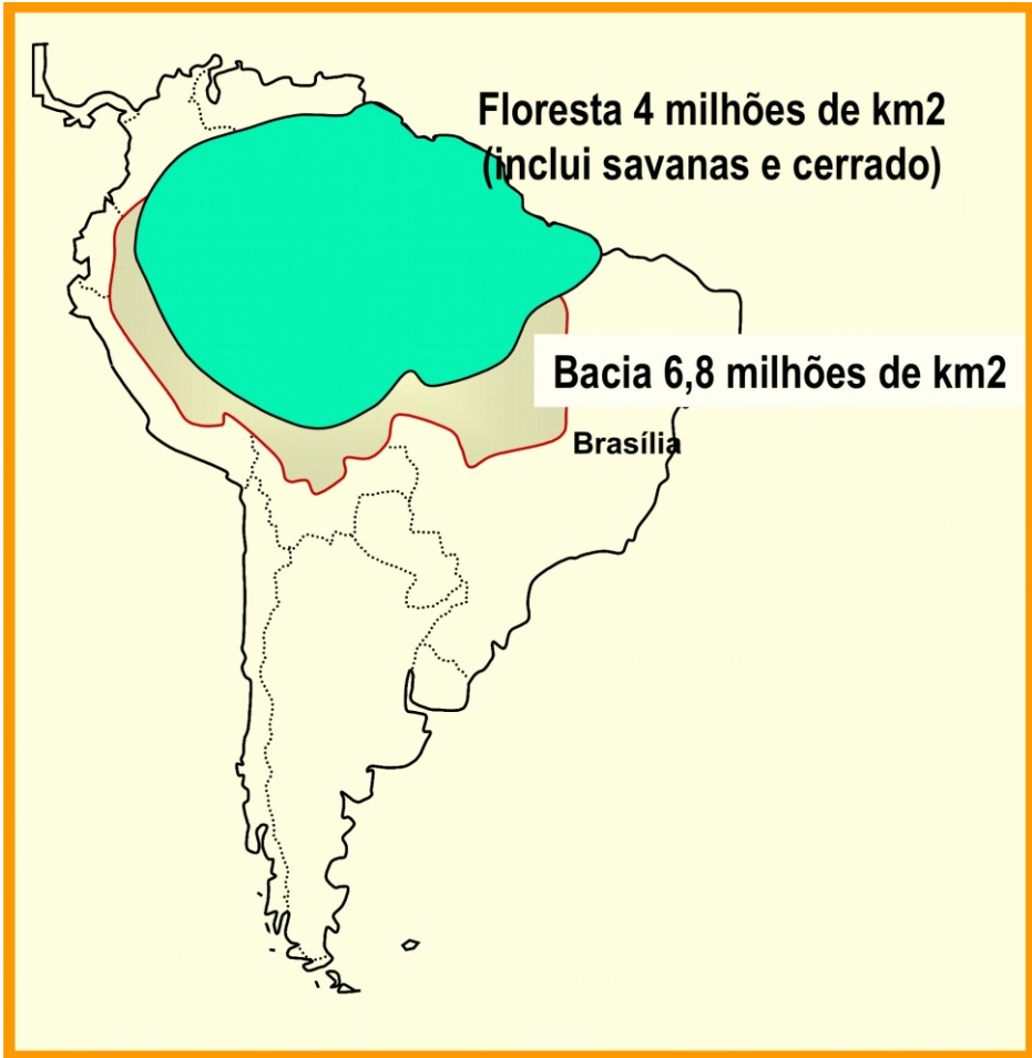
Fig. 1. Amazônia hidrográfica e florestal (baseada em "Amazonia sin mitos". TCA/PNUD/BIRD, 1993).

Quando se usam indistintamente esses conceitos, surgem absurdos como a declaração de que a batata é amazônica! É claro que não. É andina, e os Andes se originaram muito antes da Amazônia. As duas formações mais antigas do continente são o Escudo Brasileiro e o Escudo das Guianas, com mais de 2,6 bilhões de anos. Os Andes começaram a formar-se entre 180 e 150 milhões de anos atrás, sendo que o Rio Amazonas é muito mais recente, com menos de cinco milhões de anos.