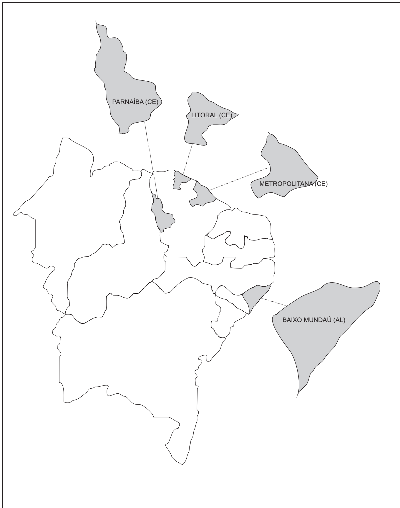
Figura 3. Localização das bacias hidrográficas em estudo no Nordeste brasileiro.

O método Vulneragri foi aplicado no estudo de quatro bacias hidrográficas: Metropolitana (CE), Litoral (CE), Baixo Mundaú (AL) e Parnaíba (CE). A Figura 3 mostra a localização das bacias no Nordeste brasileiro.