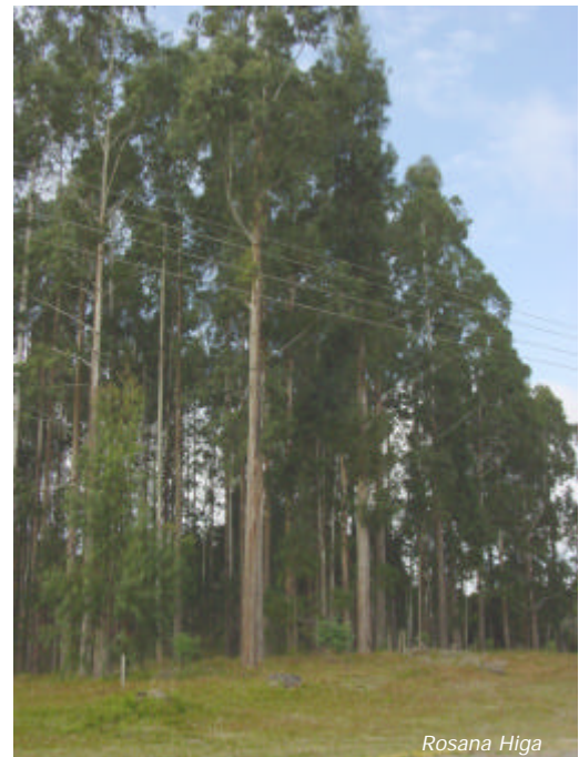
Figura 1. Área de coleta de sementes de E. benthamii , Colombo, PR.

São escassos os resultados de plantios com E. benthamii , provavelmente pela área de ocorrência natural restrita, além da ocorrência de incêndios que limitaram a produção e coleta de sementes da espécie. No Norte da Argentina, na província de Jujuy, a procedência Cox's River apresentou uma taxa de sobrevivência de 85% e produtividade de 34 m 3 por ha/ano aos sete anos de idade (Mendoza, 1983). Na África do Sul a espécie é considerada potencial para plantios em regiões de ocorrência de geadas e foi incluída no programa de melhoramento do ICFR (Institute for Commercial Forestry Research) a partir de 1994 (Swain, 1997). Na China a espécie também tem mostrado bons resultados na província de Yunnan, embora tenha sido afetada pelo déficit hídrico (Yonqi et al., 1994).