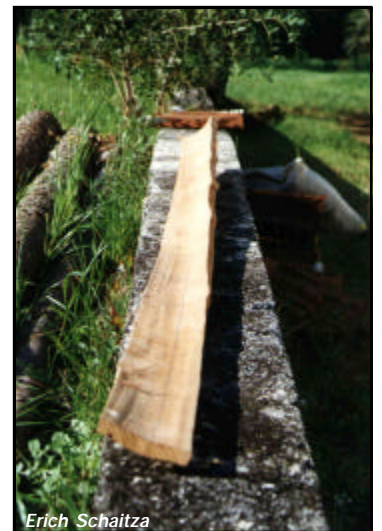
Figura 2. Amostra de madeira serrada de Eucalyptus benthamii .

Quanto ao comportamento da espécie durante o desdobro, pôde-se constatar uma forte tendência ao empenamento das tábuas, especialmente ao encanoamento, mesmo em condições amenas de secagem, à sombra (Fig. 2). É, portanto, recomendável o desenvolvimento de pesquisas e de programas de melhoramento que minimizem esses defeitos e que viabilizem o uso da madeira desta espécie para serraria.