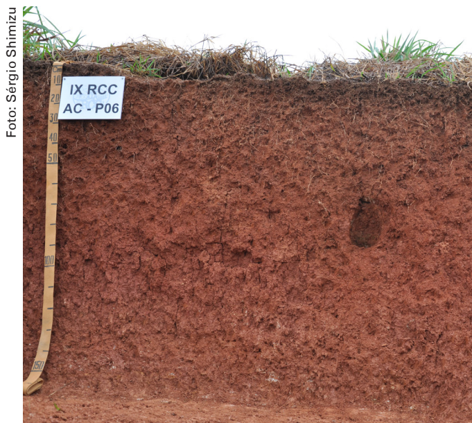
Figura 1. Exemplo de solo do Estado do Acre com elevada capacidade tampão de fosfato.

Entretanto, a disponibilidade de P do solo é dependente do FCP, o qual apresenta estreita correlação com o P remanescente (quantidade do fósforo adicionado que fica na solução de equilíbrio após determinado tempo de contato com o solo, P-rem), fazendo com que a determinação dessa fração possa ser utilizada para auxiliar na interpretação dos teores de fósforo disponível às plantas.