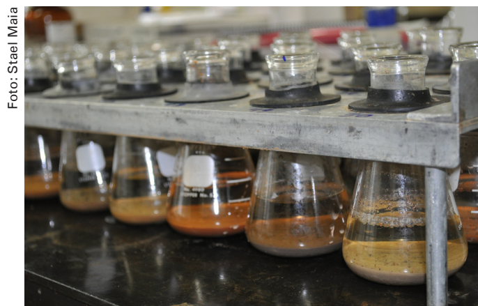
Figura 2. Extratos prontos para a dosagem dos teores de P-rem, após 16 horas de descanso.