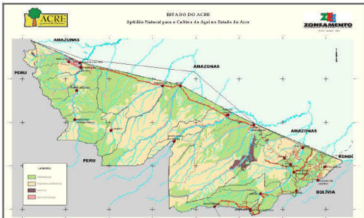
Fig. 1. Mapa de aptidão natural para o cultivo do açaí ( Euterpe oleracea Mart. e Euterpe precatoria Mart.) no Estado do Acre.

Os parâmetros selecionados foram cruzados em um sistema de informações geográficas (Arc View), obtendo-se um mapa (Fig. 1) de aptidão natural para o cultivo do açaí, na escala de 1:35.000.