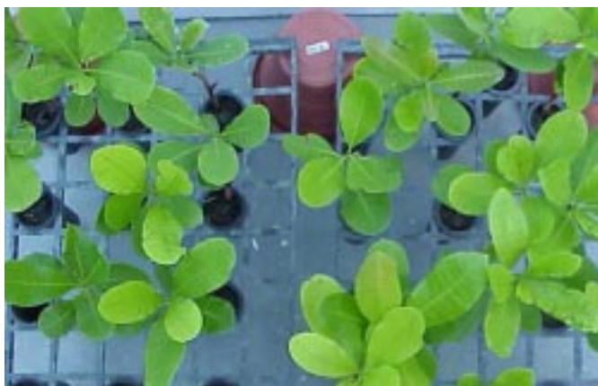
Fig. 3. Visão geral de plantas de cajueiro-anão precoce após 30 dias de aplicação da salinidade.

Os tratamentos não diferiram estatisticamente entre si a p \leq 0,05 , pelo teste de Tukey.